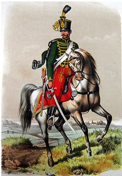
Husar des Regiments Nr. 9