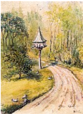
Taubenhaus im Schlosspark gemalt von Karl Rebel, 1934