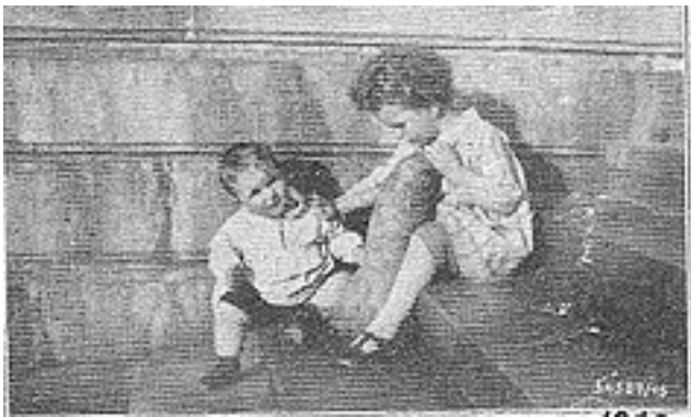
1932, Futterrübe, 11 ½ Pf. Anna Maria, Theresia

Im Herbst 1944 wurden nur wenige Felder mit Getreide bestellt. Wie immer aber waren von der Ernte her auf den Feldern Körner übriggeblieben, die dann im Frühjahr 1945 austrieben, so dass im Sommer Ähren/Körner zum Schroten geerntet werden konnten. Eine große Hilfe, denn zu dieser Zeit gab es überhaupt nichts mehr zu essen.