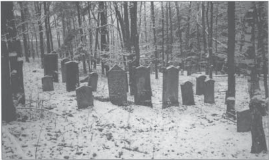
Judenfriedhof in Städtel (1996)