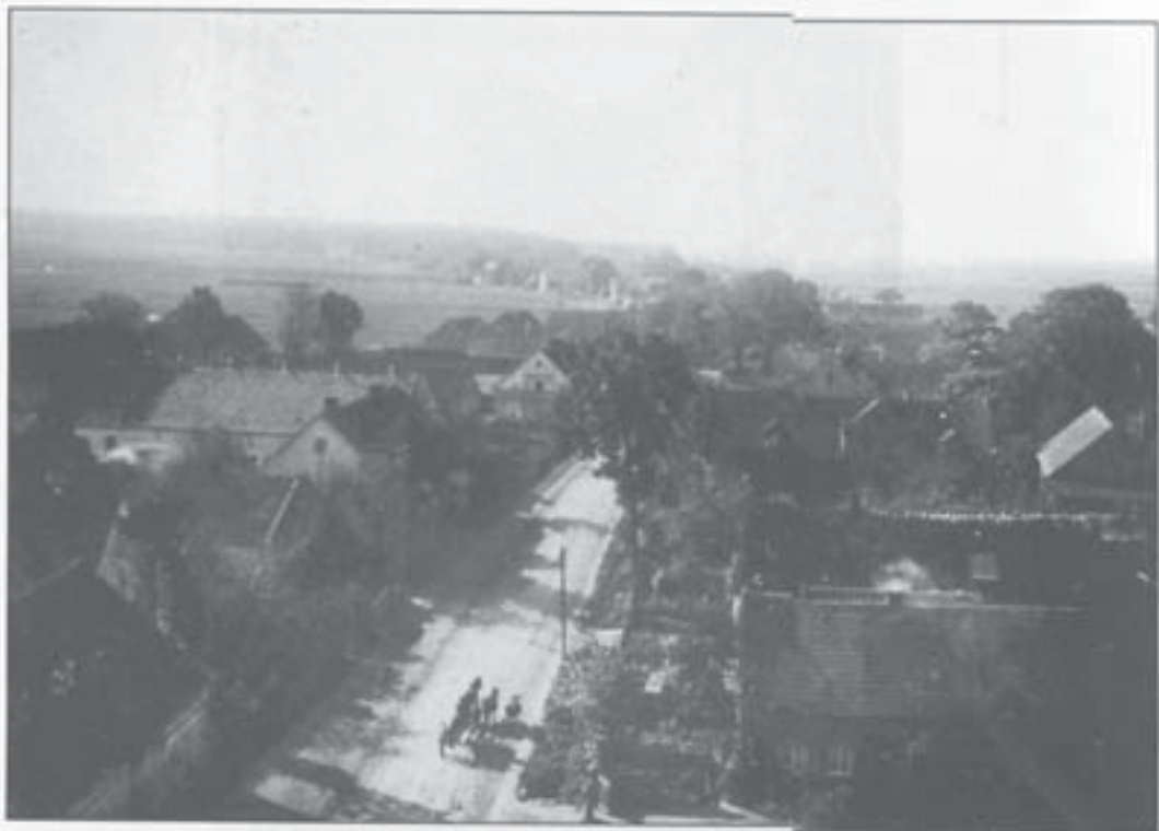
Westlicher Dorfteil (1931)