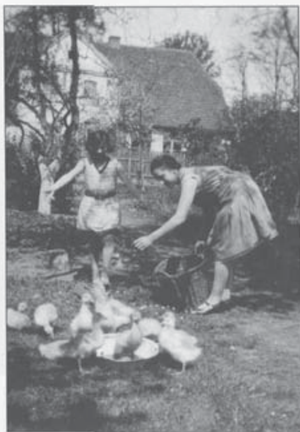
Gutsgarten Frauenholz (1928/29)