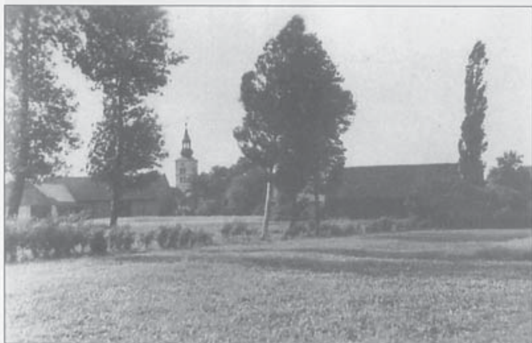
Blick vom Sportplatz zur luth. Kirche (1935)