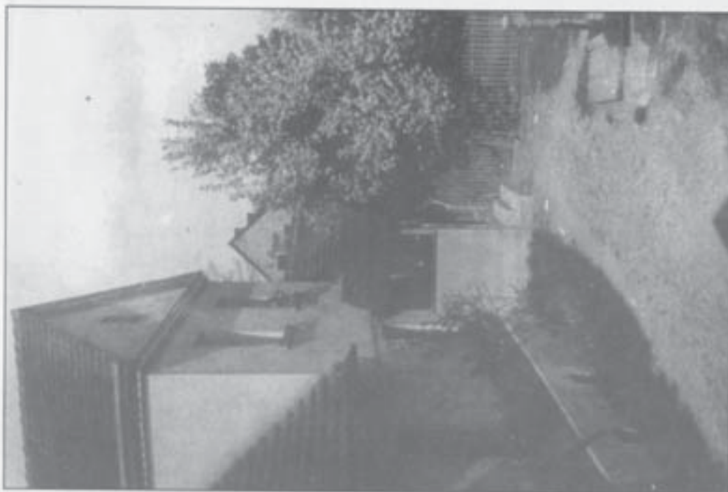
Südseite der kath. Schule (1931)