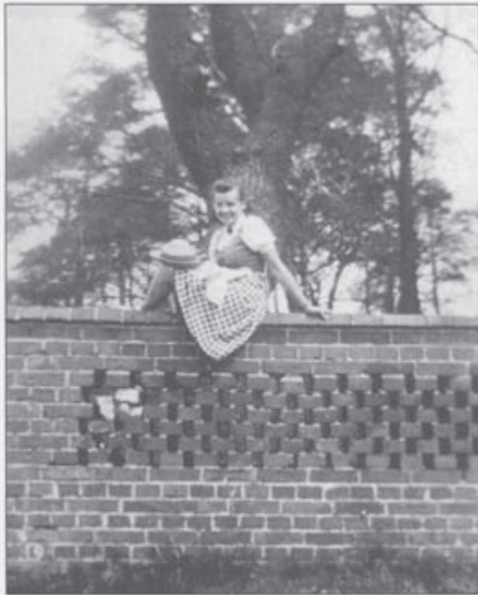
Mauer des Judenfriedhofs (1936)