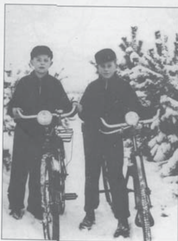
Gehr. Schlegel im Kiefernwäldchen (1938)