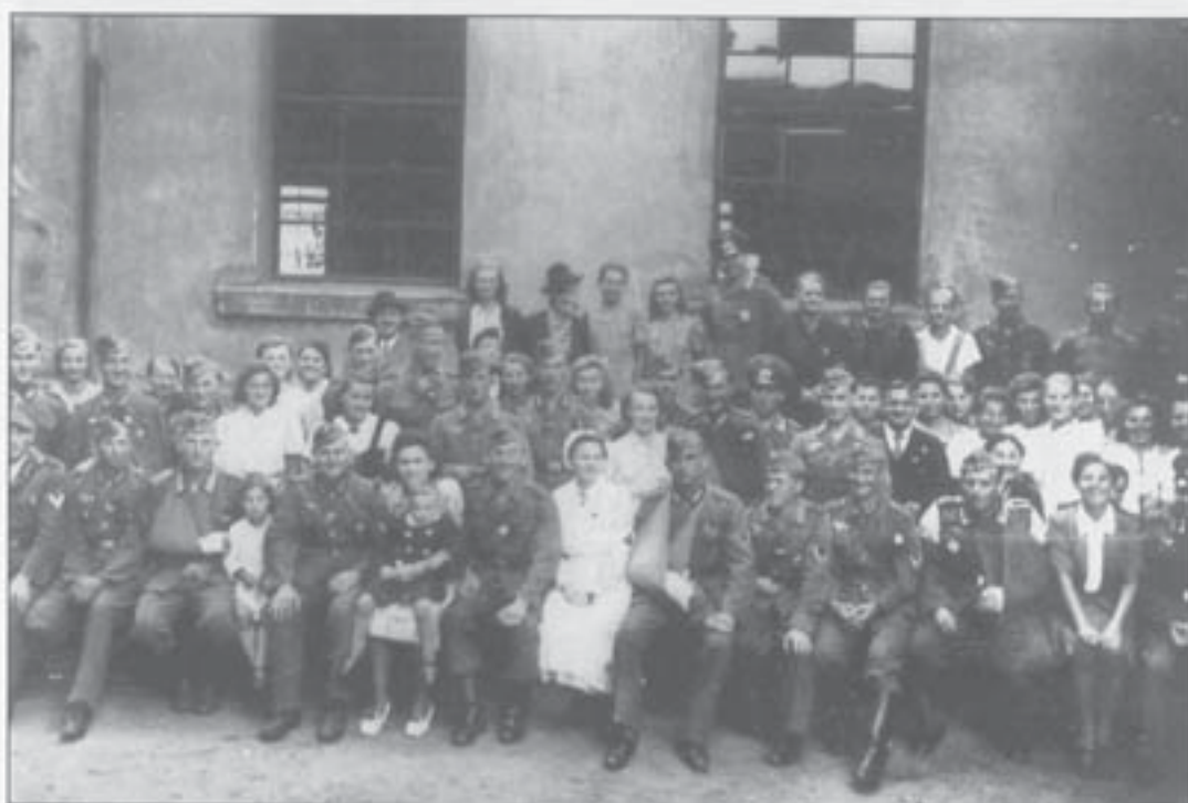
Verwundete Soldaten in Schwirz (1944)