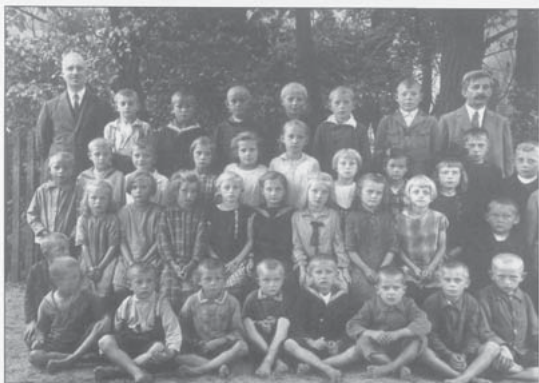
Schulklasse der kath. Volksschule (1931)