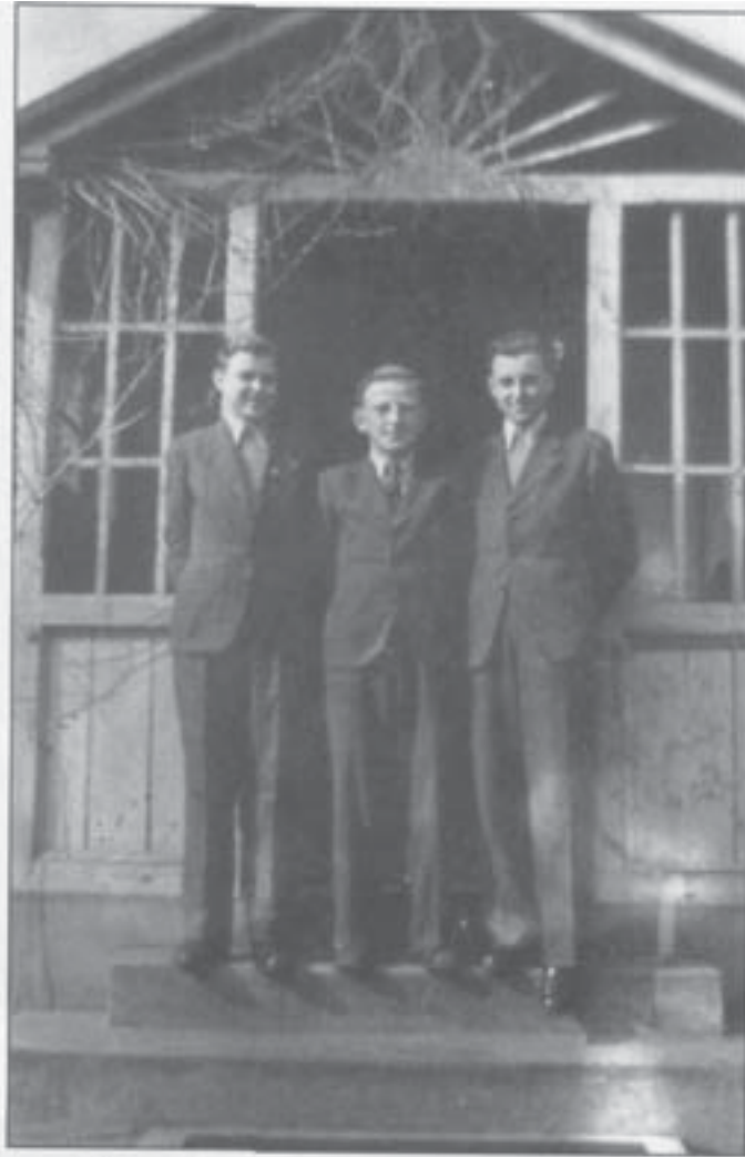
Hintereingang der kath. Schule (1943)