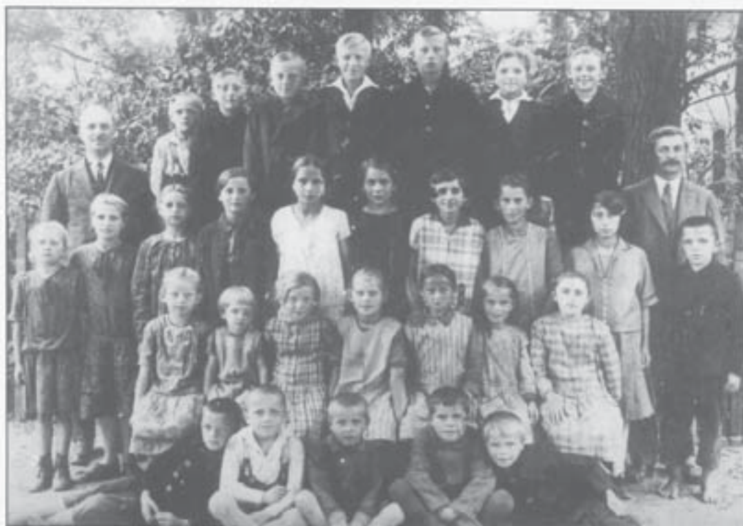
1. bis 4. Klasse der kath. Volksschule (1929)