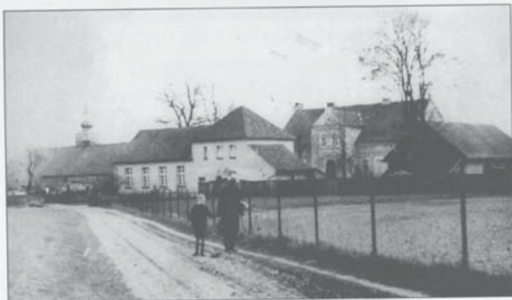
Altluh. Pfarrei mit Jugendheim (1934)