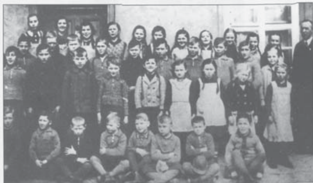
1. bis 8. Klasse der ev. Schule (1937/38)