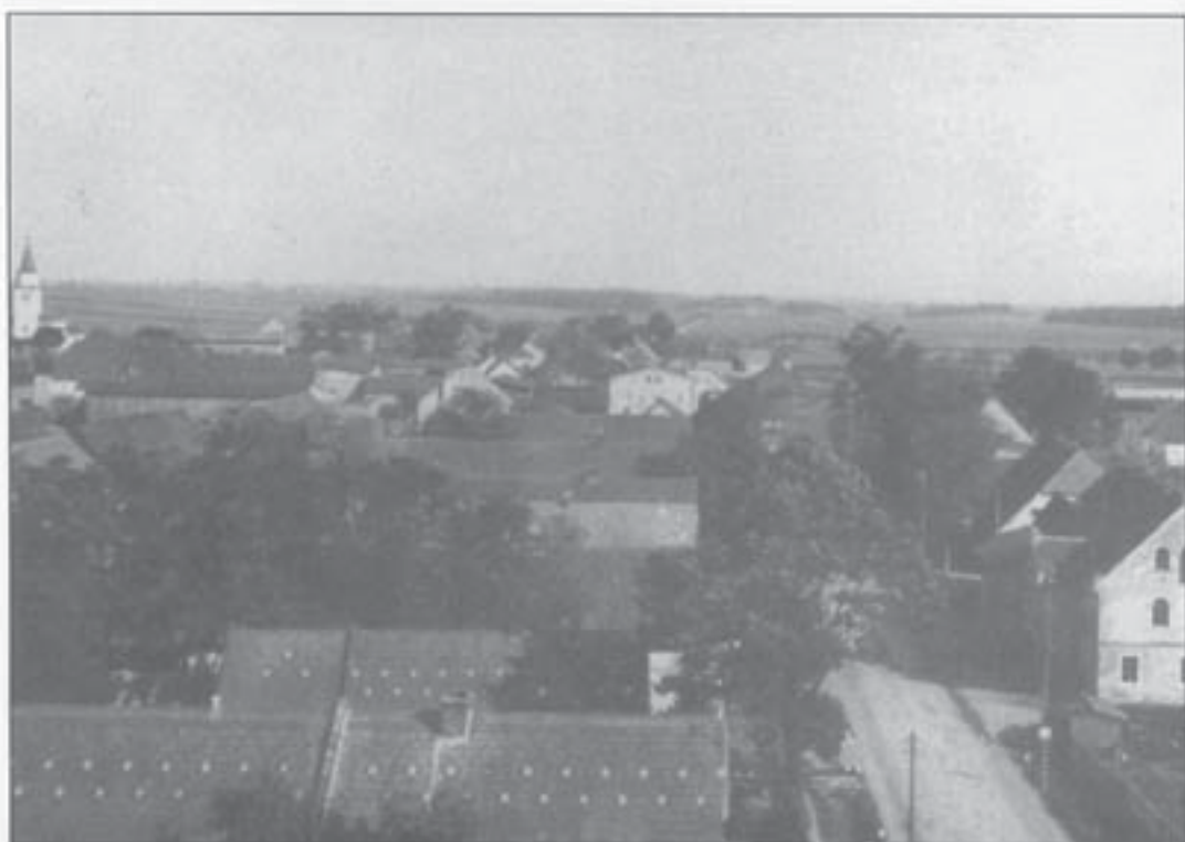
Östlicher Dorfteil (1931)