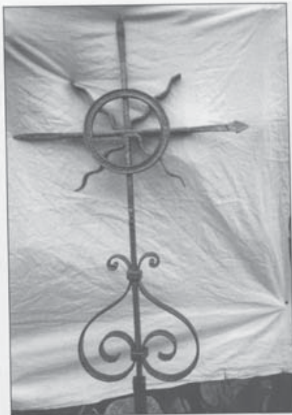
Schwirzer Gruftkreuz (1995)