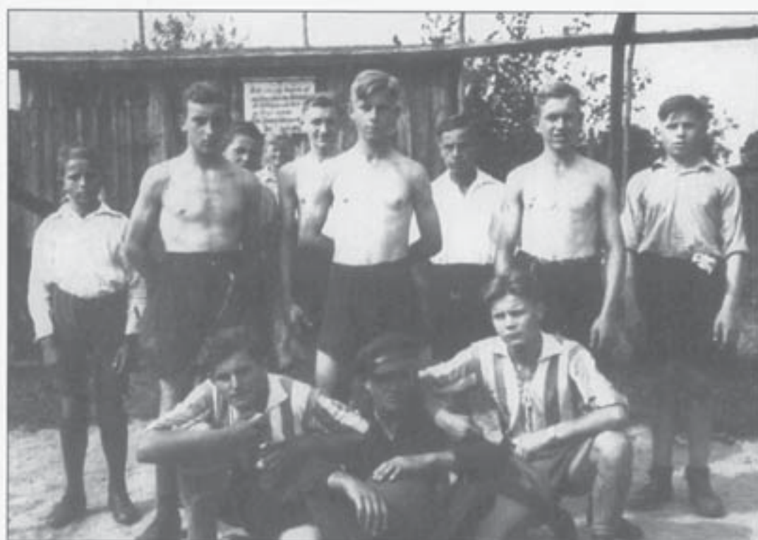
2. Fußballmannschaft (1938)