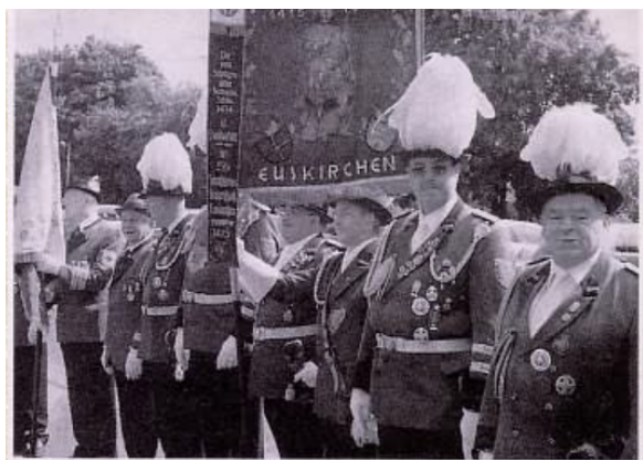
Die befreundeten Euskirchener St. Sebastianus-Schützen beim 25. Großen Heimattreffen zu Pfingsten 2004 in Euskirchen.