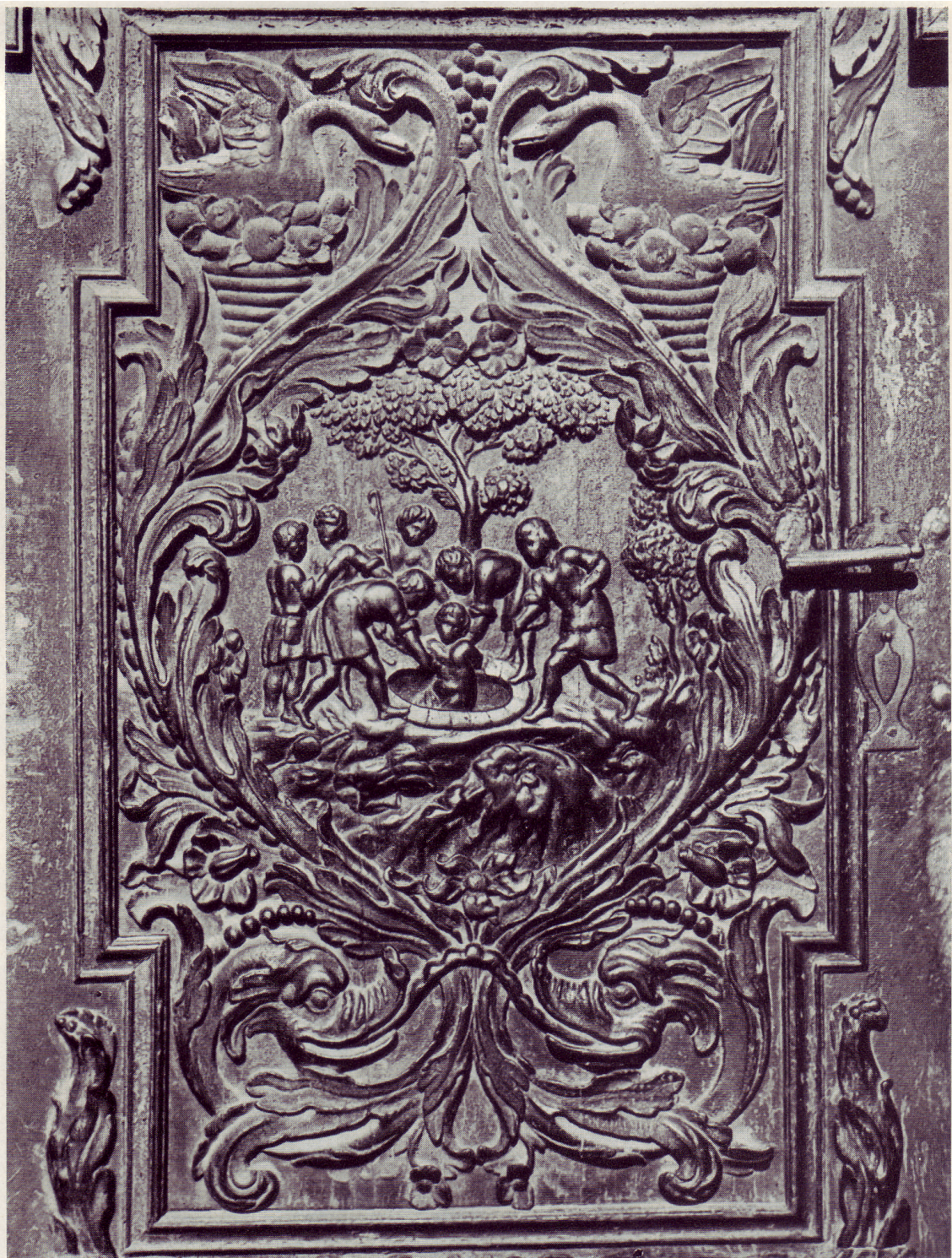
Breslau, Domtür, im Jahre 1671 eingesetzt anlässlich des Einzugs von Landgraf Friedrich von Hessen als Bischof von Breslau (vgl. den umseitigen Beitrag)