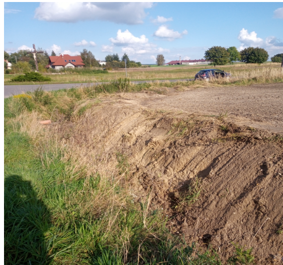
Massengrab bei Glausche