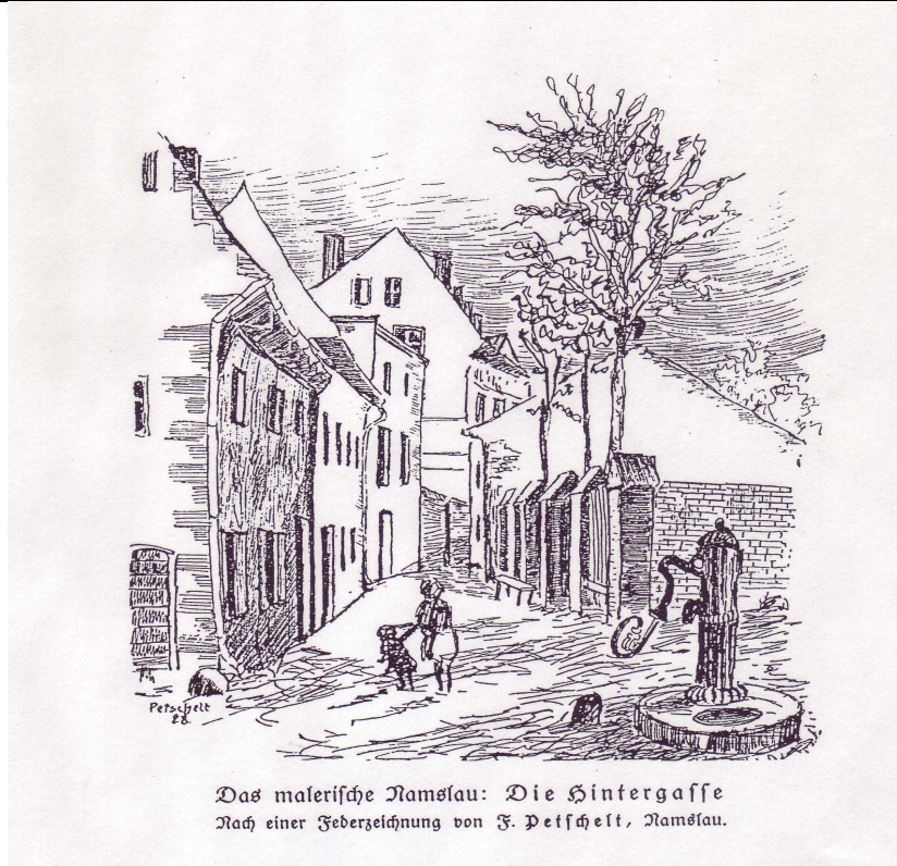
Das malerische Namslau: Die Hintergasse Nach einer Federzeichnung von F. Petershelt, Namslau.