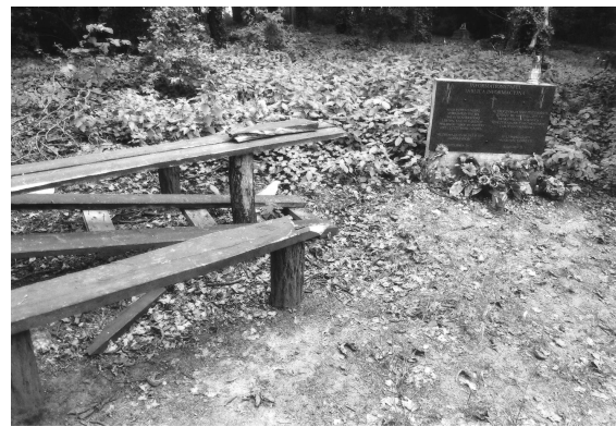
Bank und Tisch zerstört