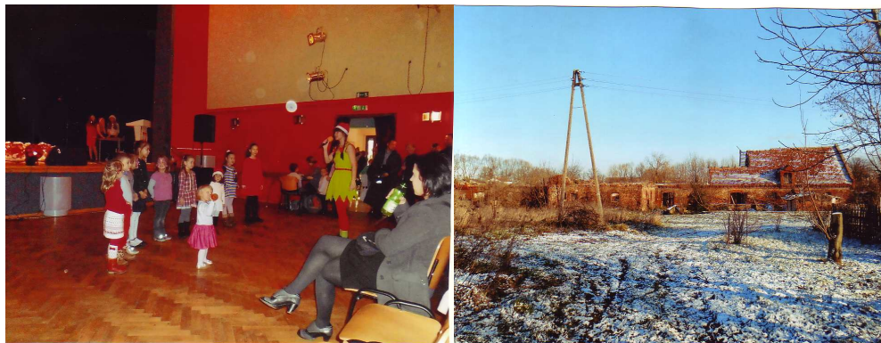
Die Kleinsten mit der Nikolausfrau

P.S. Im September 2018 findet in der Jahrhunderthalle in Breslau wieder das Festival der deutschsprachigen Minderheit statt. Stargast ist Stefanie Hertel.