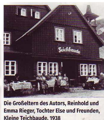
aus: Schlesische Nachrichten 12.2017