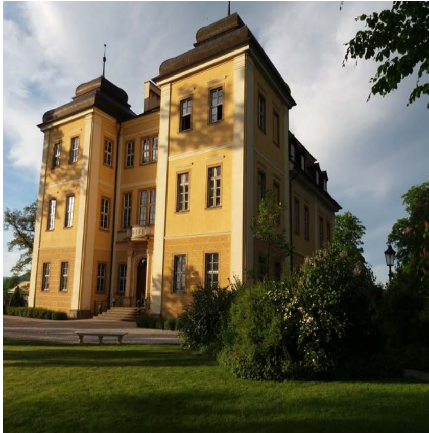
Schloß Lomnitz (Palac Lomnica)

Palac Staniszow (ehemals Stonsdorf), Karpacz (ehemals Krummhübel) mit dem herrlichen Karkonosze Nationalpark. Wir genießen bei herrlichem Wetter und einer Fahrt mit dem Lift den Blick auf die Schneekoppe.