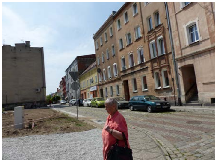
Brauhausstraße mit Blickrichtung Marktplatz

Auf der Rückfahrt nach Namyslow besuchen wir noch den Friedhof der Stadt, auf dem unser Vater bzw. Großvater begraben ist. Die direkte Grabstelle ist nicht mehr sichtbar, aber in etwa kann mir meine Mutti die Stelle seines Grabes zeigen. In den nächsten Tagen erkunden wir die Stadt weiter: Wir laufen durch die Brauhausstraße, in der meine Mutti mit ihrer Schwester und ihrer Mutti nach der Rückkehr 1945 bis zum endgültigen Verlassen der Stadt im Herbst 1946 lebte. Dabei konnten wir beobachten, wie sich die Straße verändert, denn an deren Ende wurden Häuser abgerissen und ein kleiner Park wird angelegt.