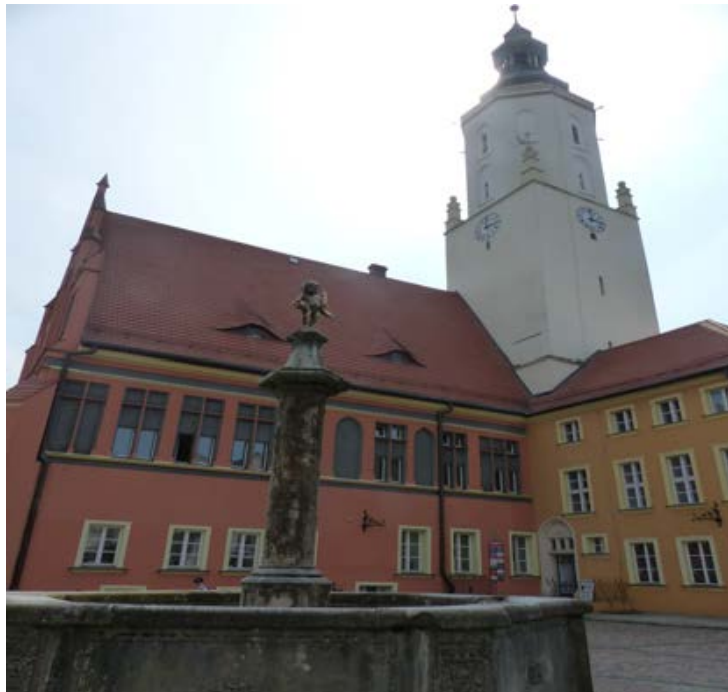
Blick zum Rathaus

Nach unserem Schulbesuch sehen wir uns in der Katholischen Kirche um. Die Kirche ist wunderschön gestaltet, da in dieser Zeit die Kommunionen stattfinden. Weiter bummeln wir zum Rathaus. Wir sprechen bei den Beamten des Archivs vor. Leider kann man uns in unserer Angelegenheit nicht helfen, gibt uns aber eine Adresse für das Archiv in Oppeln (Opole). Nun sehen wir uns den Markt/Ring (Rynek) an, essen ein typisch polnisches Mittagbrot in einem Bistro.