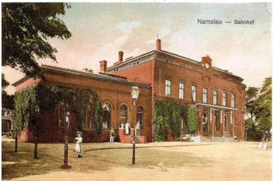
der „alte“ Bahnhof