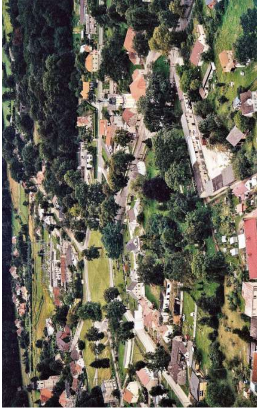
Carlsruhe (Pokoj) im Rondell stand das Schloss, in der rechten Hälfte: Sophienkirche