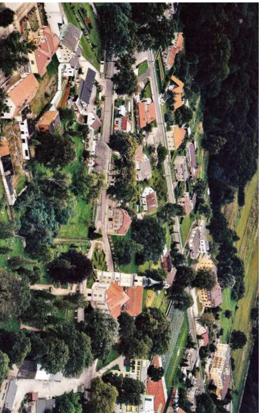
Carlsruhe (Pokoj) rechts im Bild : katholische Kirche