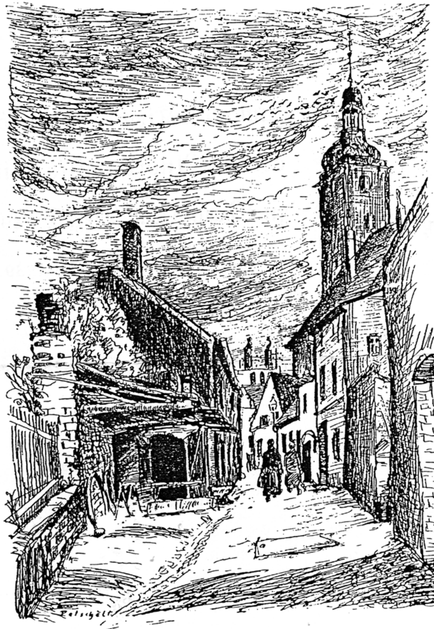
Das malerische Namslau: Langstraße mit Bild auf die evang. Kirche. Nach einer Federzeichnung von F. Pelschelt, Namslau.