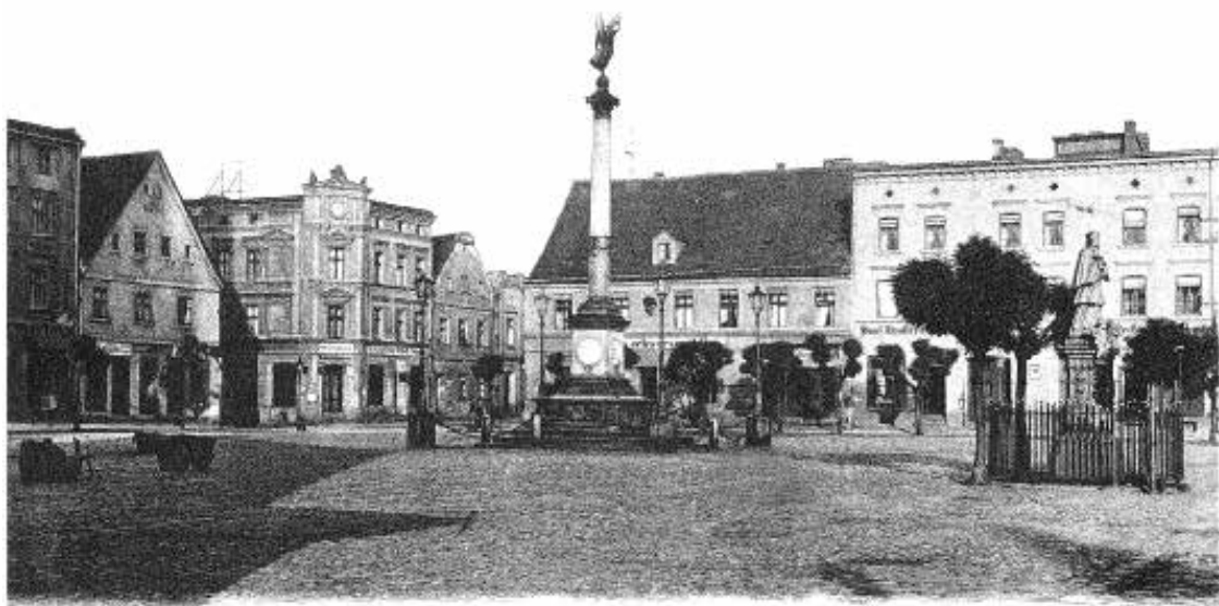
Gruss aus Namslau