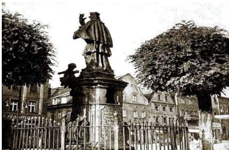
Nepomuk—an seinem früheren Platz auf dem Namslauer Ring