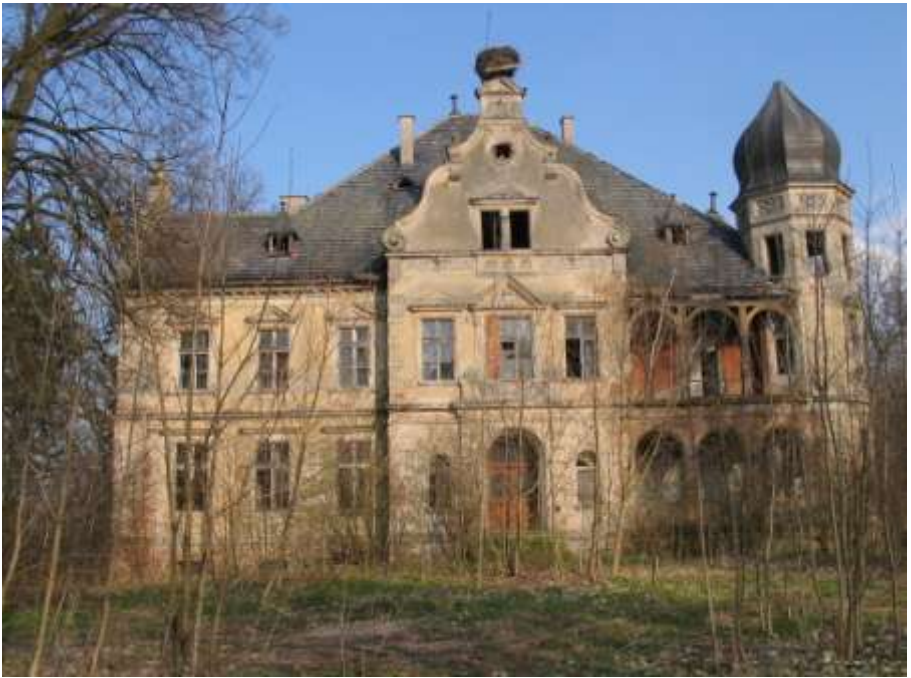
Schloss Simmelwitz: gestern—heute