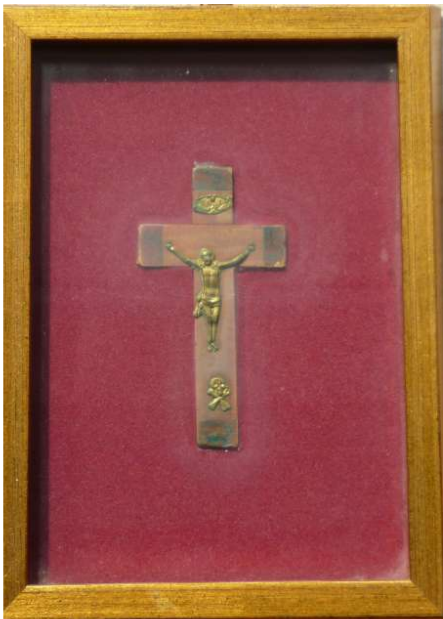
Verkauft als „Baustein“ (gefertigt aus dem Kreuz der alten Holzkirche in Schmograu) für den Wiederaufbau der niedergebrannten Kirche