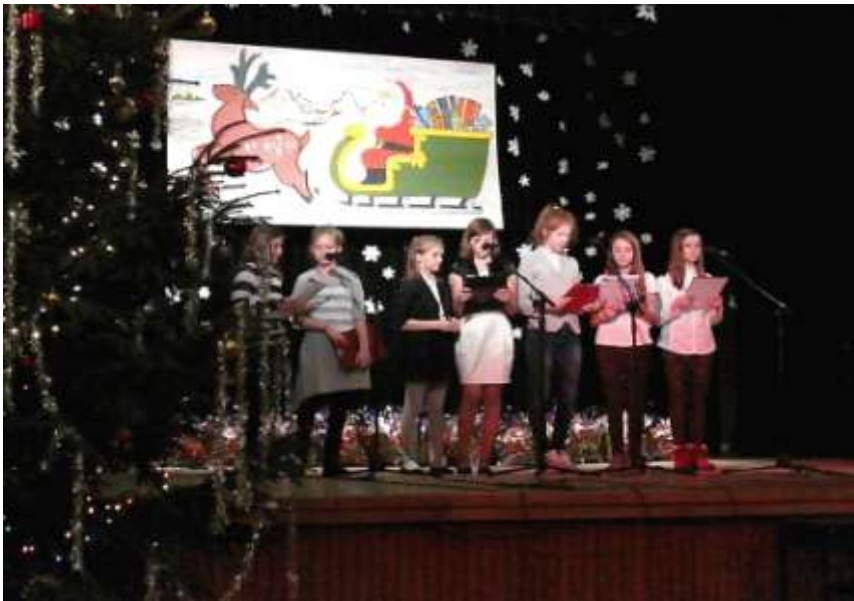
Schülerinnen der Schule 3 singen bei der Weihnachtsfeier