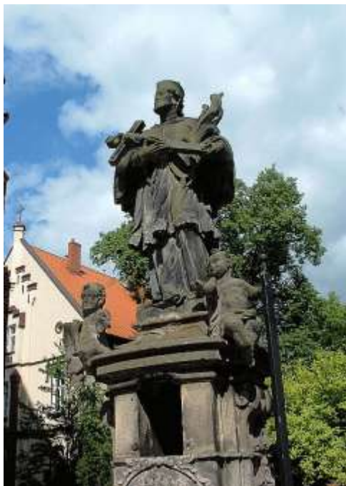
Der „Nepomuk“ heute : vor dem katholischen Pfarrhaus