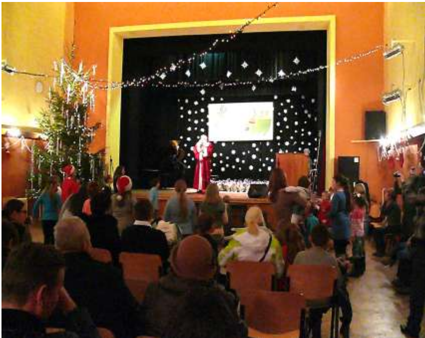
... der Nikolaus begrüßt seine „Kinder“