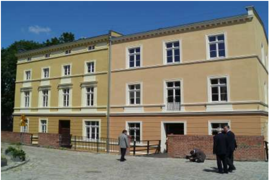
Die „alte“ Stadtmühle—heute: Mühlenmuseum