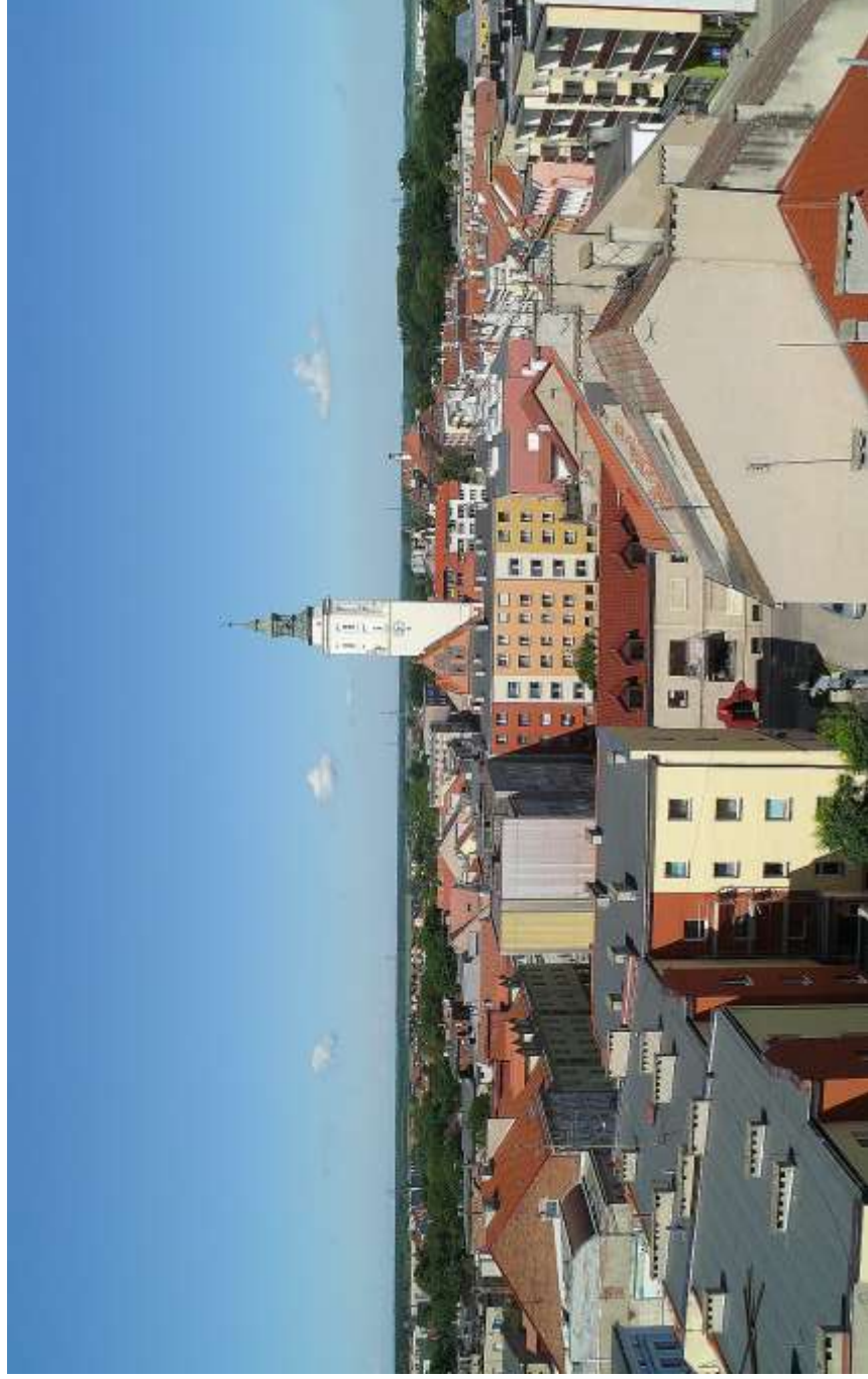
Vom Krakauer Tor—im Juni 2013