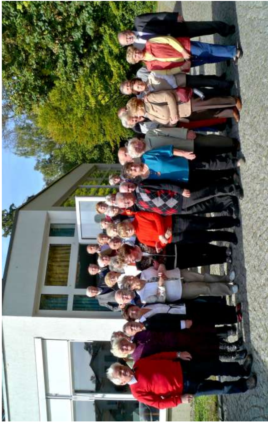
2. Namslauer Treffen inNeustadt/Dosse am 4. Oktober 2013