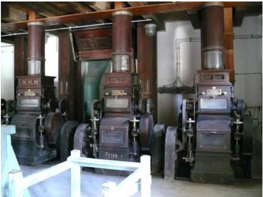
... mit Mühlen aus dem ganzen Land (noch funktionsfähig)