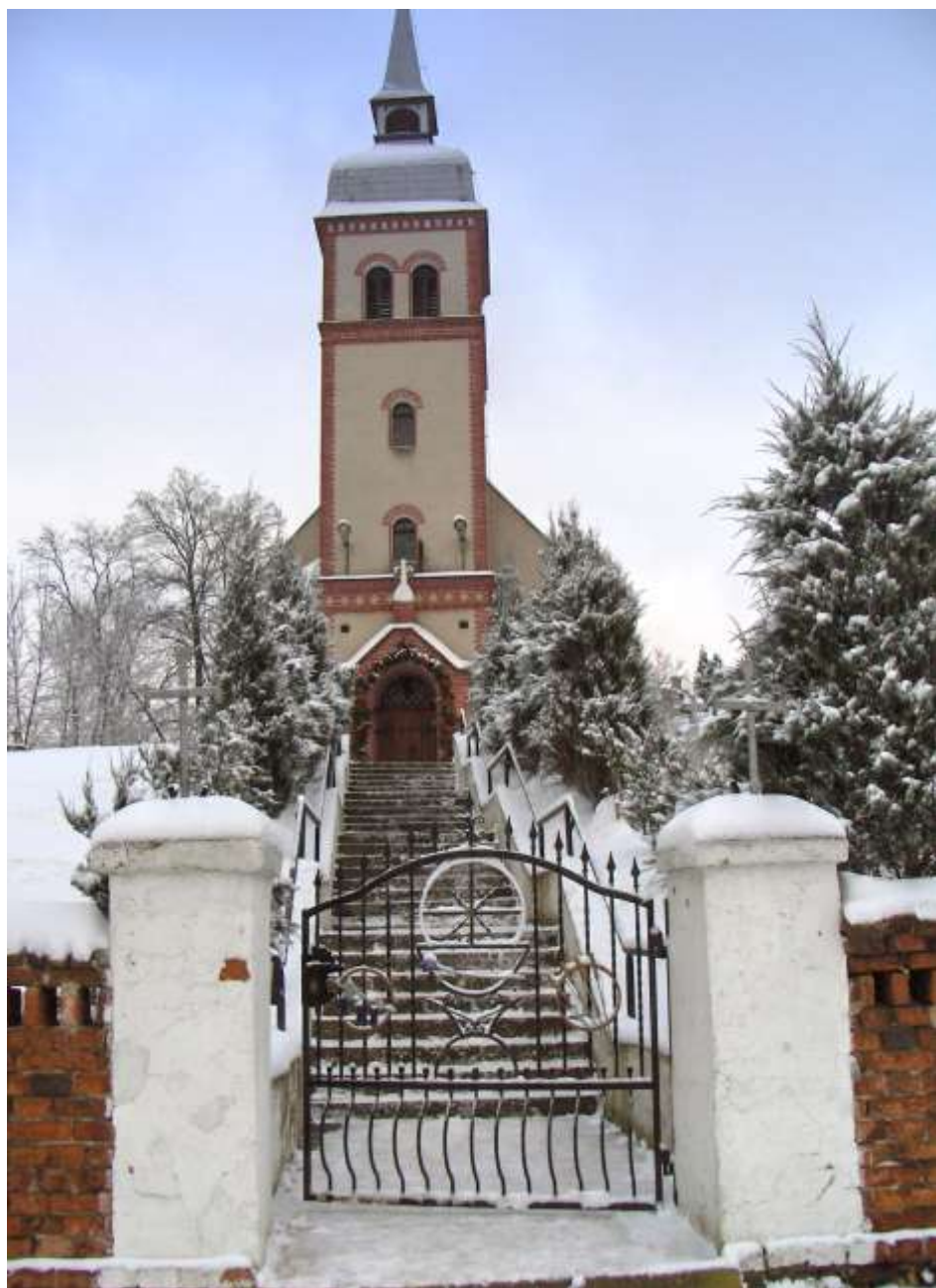
Die Kirche in Dammer lädt ein zum Weihnachtsgottesdienst