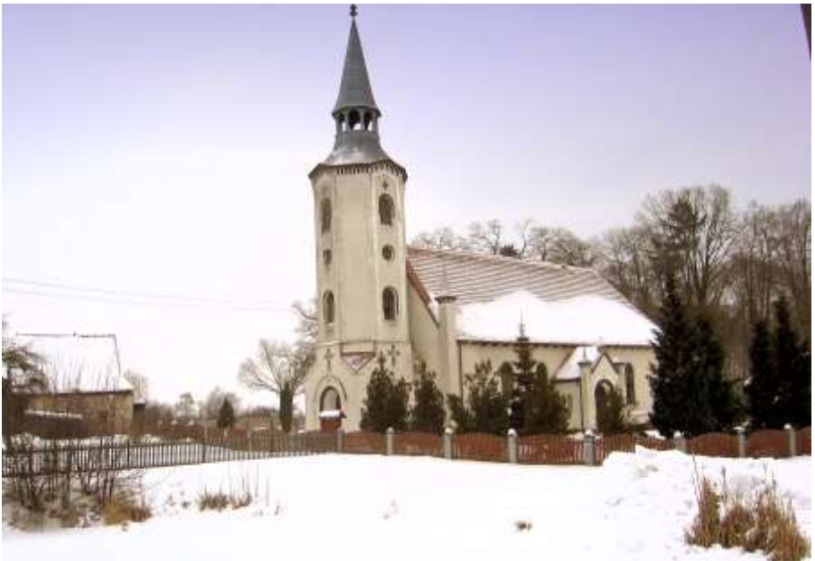
die Kirche von Steinersdorf