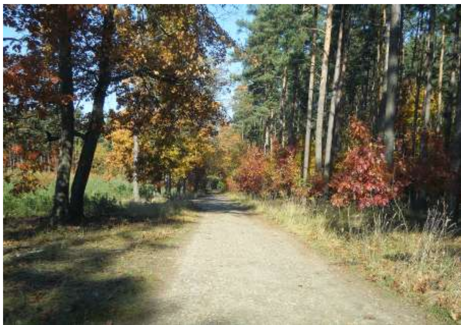
in den Wäldern um Bachwitz