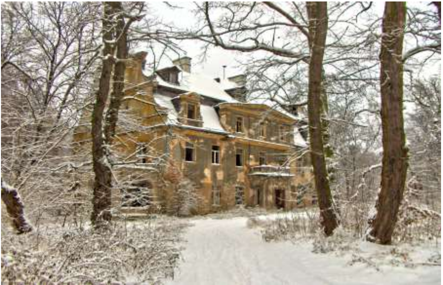
das Schloss von Eckersdorf (heute)