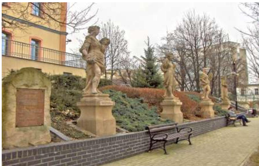
früher: „Die vier Jahreszeiten“ im Schloss von Eckersdorf heute: Zierde auf dem Universitätsgelände in Oppeln