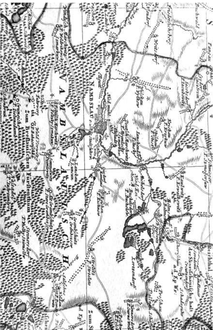
Districtu Namblaviensi in einer Karte von 1736