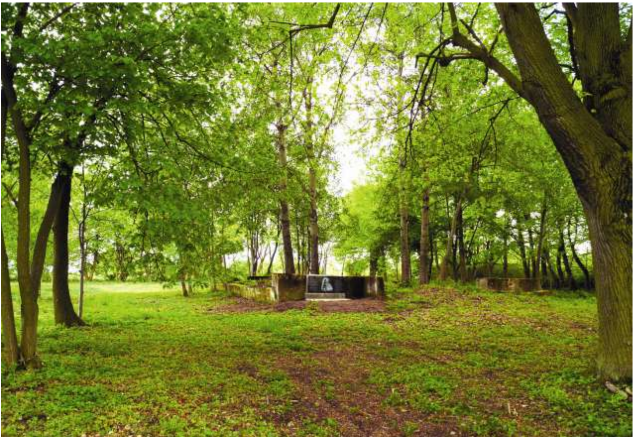
Friedhof von Paulsdorf 2010