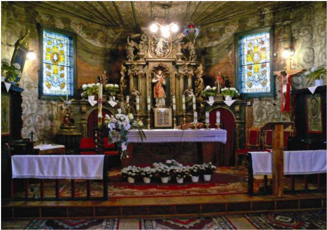
Schrotholzkirche in Lorzendorf