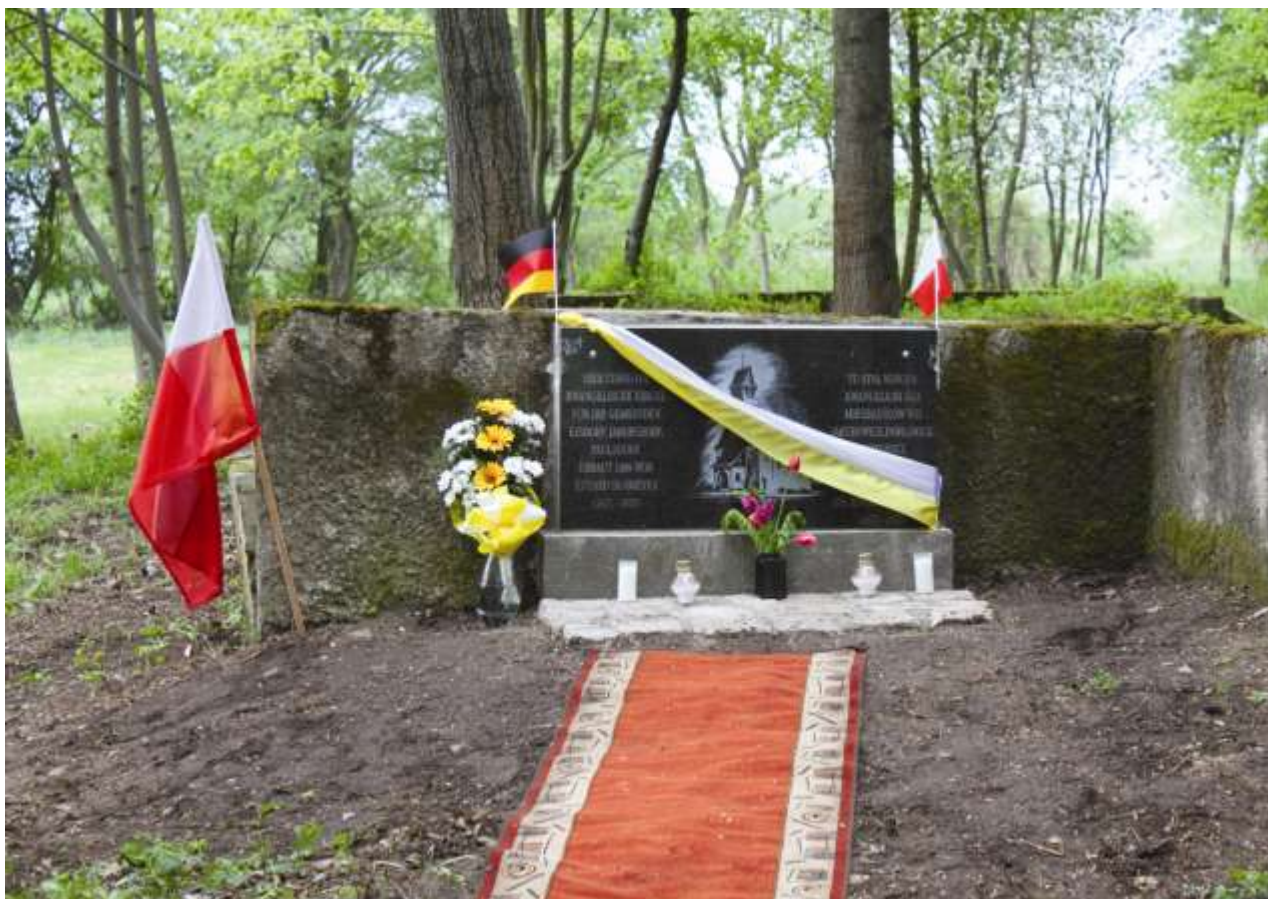
Gedenkstein auf dem Friedhof von Paulsdorf