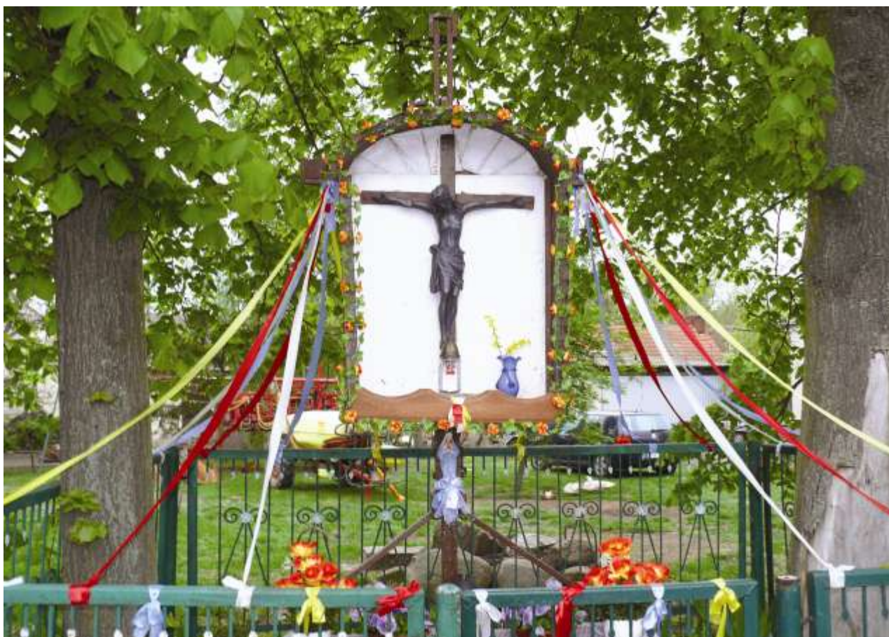
Altarkreuz der ehemaligen Kirche von Paulsdorf