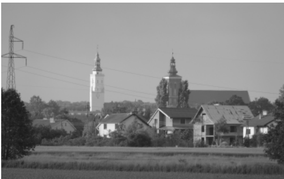
auf dem Weg von Namslau nach Groß Marchwitz

Ich würde mich freuen, wenn wir auch in Zukunft auf diese vertrauensvolle Zusammenarbeit bauen dürfen.