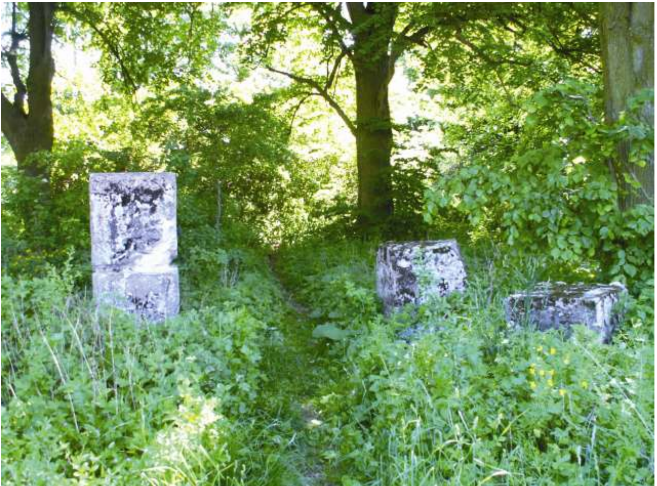
Friedhof von Paulsdorf 2008