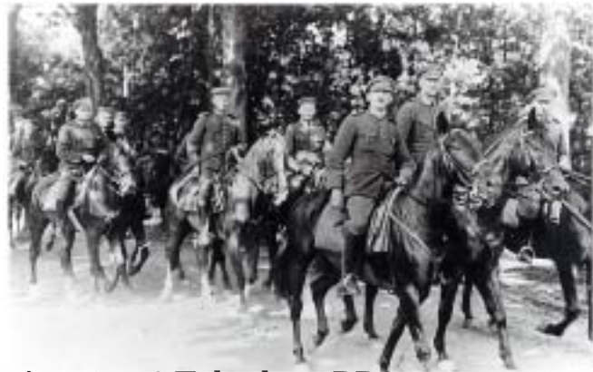
Ausritt: 4 Eskadron RR8