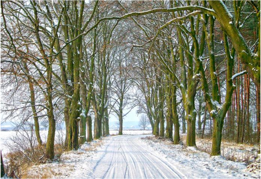
Winter: im Hintergrund Sophienthal bei -23^{\circ}\text{C}