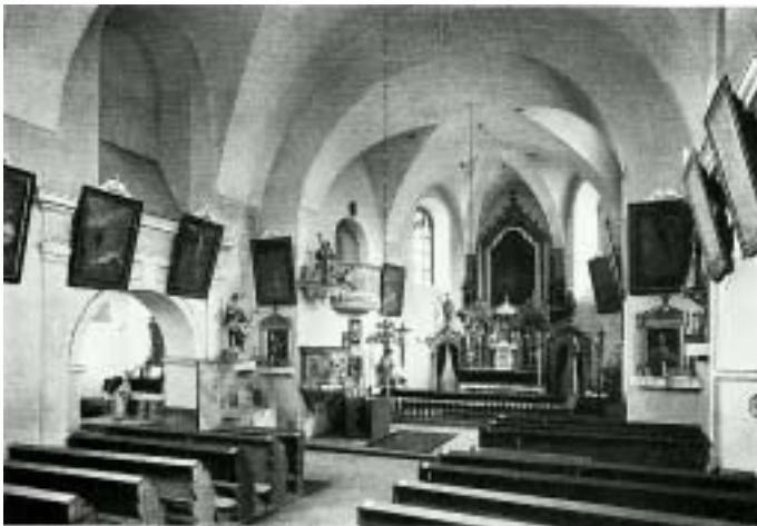
kath. Kirche Buchelsdorf