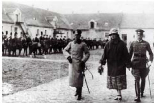
Kronprinzessin Cecilie besucht die 4. Eskadron RR8 im Standort Namslau 1926/27?

Einer der Reiteroffiziere, die 1936 die Goldmedaille bei den Olympischen Spielen in Berlin errang, war der Oberleutnant Freiherr von Wangenheim mit dem Pferd „Kurfürst“, er stand bei der 5. Schwadron R 8 in Namslau. Er errang diese Medaille mit dem Major Stubbendorff und Rittmeister Lippert. Von Wangenheim