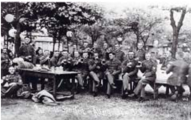
4 Eskadron RR8 nach einem Regiments sportfest in Altengrabow 1929

Als der Volkssturm im Herbst 1944 aufgestellt wurde, existierte im Volksmund die Redewendung: "Zur Aufstellung des Volkssturmes: 'Bekleidung und Verpflegung sind mitzubringen, Armbinde und Feind stellt das Deutsche Reich'."