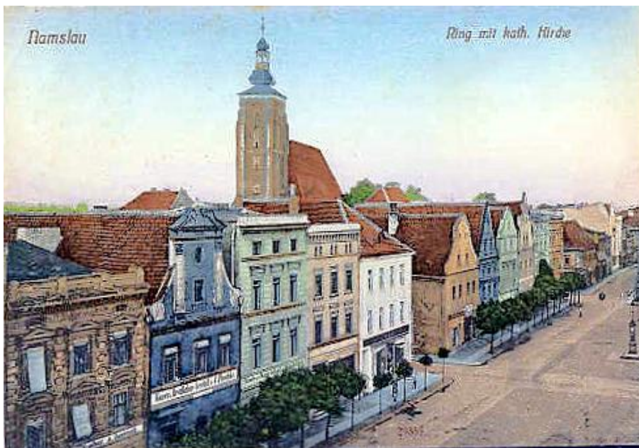
Namslau im Jahre 1912