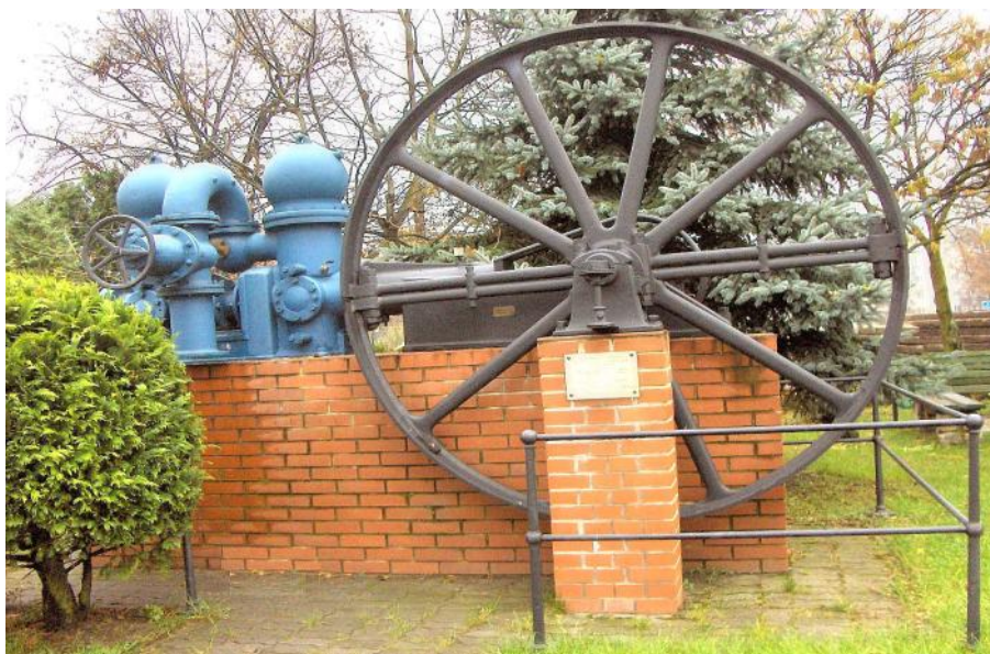
Baujahr 1911 bis in die 70er Jahre in Betrieb— steht heute im Wasserwerk