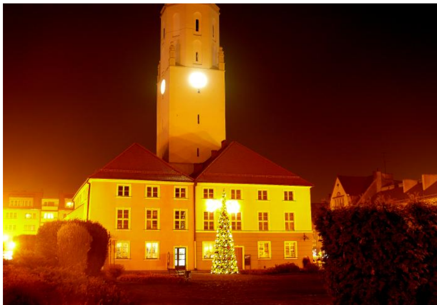
Das Rathaus im Advent 2009