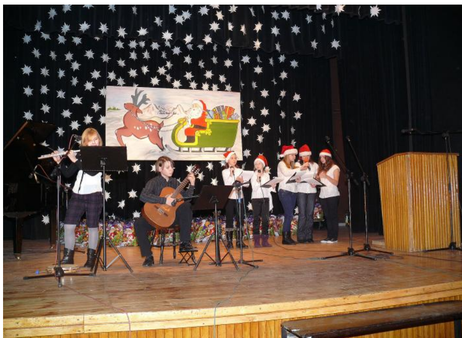
Deutsche Weihnachtslieder dargeboten von der Schule 3