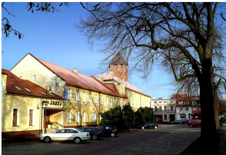
„Am Wall“ - links das neue Hotel