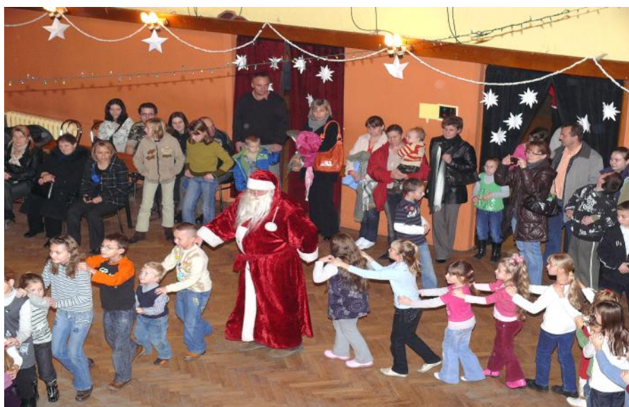
Der Nikolaus inmitten „seines Volkes“