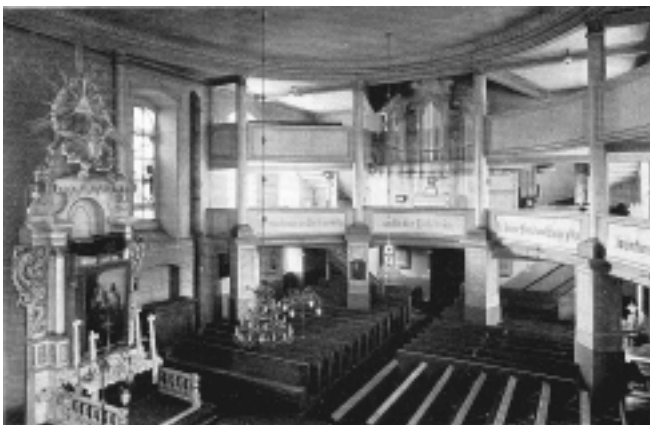
evangelische Kirche Namslau

Werner Krawatzeck, Falkenstrasse 22 , 01067 Dresden.