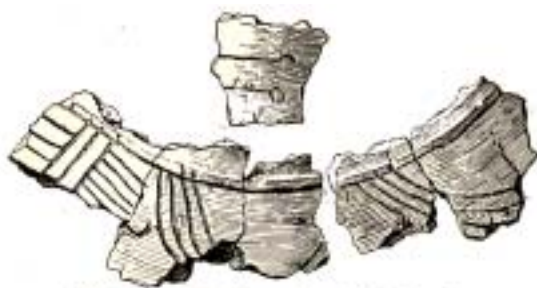
Abb. 12. Hals- und Schulterreste einer „männlichen“ Gesichtsurne

Gesichtsurnen wissen wir, daß man an den auf ihnen eingeritzten Darstellungen oftmals genau unterscheiden kann, ob sie den Knochenresten einer männlichen oder einer weiblichen Leiche als Behältnis dienten. Auch in Kaulwitz lässt sich das noch nachweisen, denn Urnen mit einer Scheibenknopfnadel am Halse weisen auf die weibliche Tracht bei den Frühgermanen hin und wurden daher für Frauenbestattungen gewählt. Der Mann trug am Hals oder auf der Schulter dagegen zwei waagrecht eingesteckte Nadeln mit kleinem Kopf, meist wohl die so genannten „Schwanenhalsnadeln“, die auch nicht selten wohl erhalten in Urnen gefunden werden. Eine so gekennzeichnete „männliche“ Gesichtsurne ist zwar aus Kaulwitz nicht erhalten geblieben, doch liefern