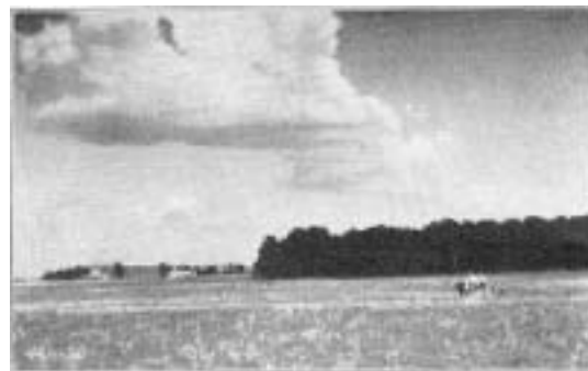
Abb. 19. Bild auf die Fundstelle der Gesichtsurnen von Kaulwitz

An der Fundstelle der frühgermanischen Funde von Kaulwitz ist schon mehrmals gegraben worden. Sie liegt im Südteil der Dorfgemarkung, wenige 100m nördlich des in die Weide mündenden Studnitz-Baches und in der Nähe eines Wäldchens, das nebst den Häusern des Vorwerks Neuhof auf unserem Bild (Abb.19) sichtbar wird. Hier unternahm seit dem Jahre 1883 der Rittergutsbesitzer Edgar Graf Henckel-Donnersmarck Ausgrabungen, bei denen die schönen Gesichtsurnen zu Tage kamen, die er später mit ihrem Inhalt und ihren Beigefäßen dem Breslauer Museum schenkte. Anscheinend hat er damals mehrere aus Platten erbaute Steinlisten gefunden. Im Jahre 1896