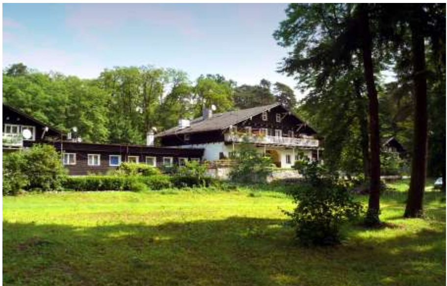
In „alter“ Frische --Schützenhaus (Juni 2009)