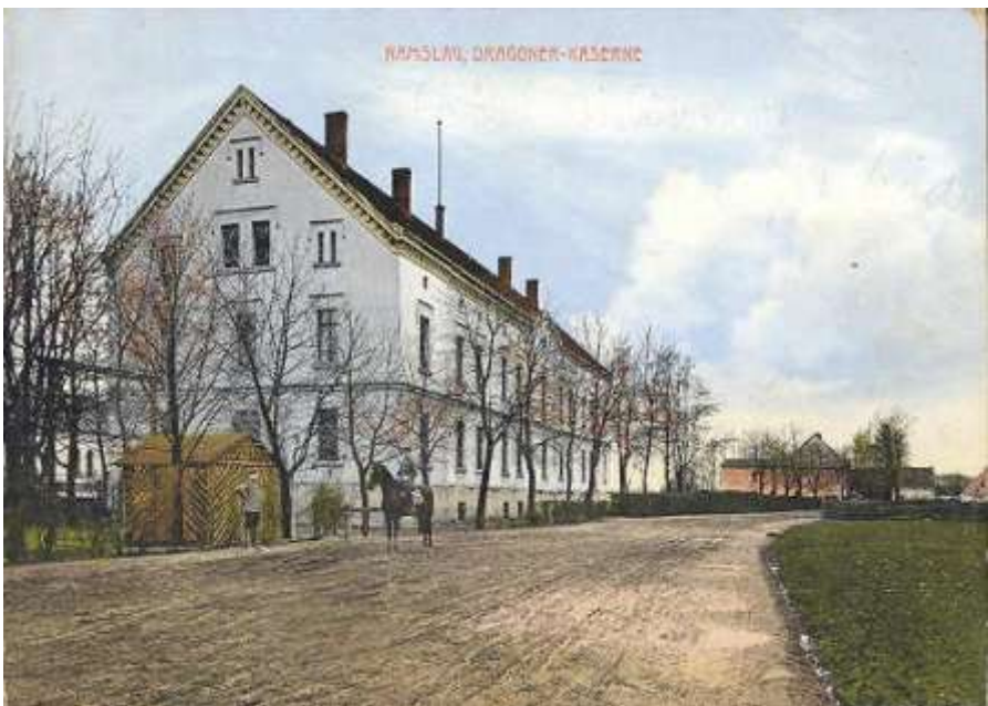
Dragoner Kaserne Namslau