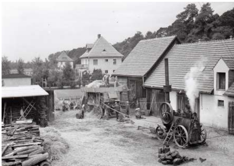
Dreschen in der Parkstraße/Ecke Stadtpark ca 1932– Maschinen aus Krickau