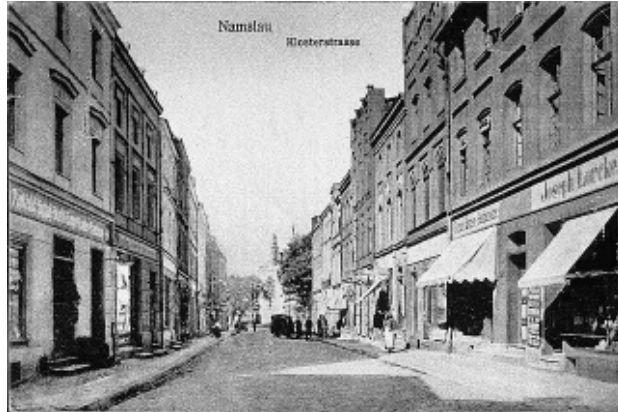
Klosterstraße - vom Ring aus (1912)