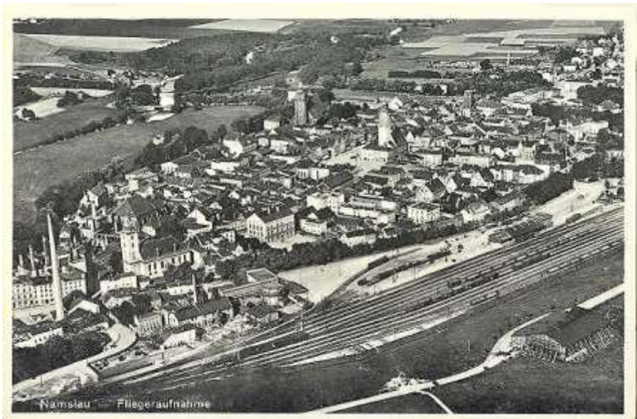
Namslau 1920-1930 (Fliegeraufnahme)